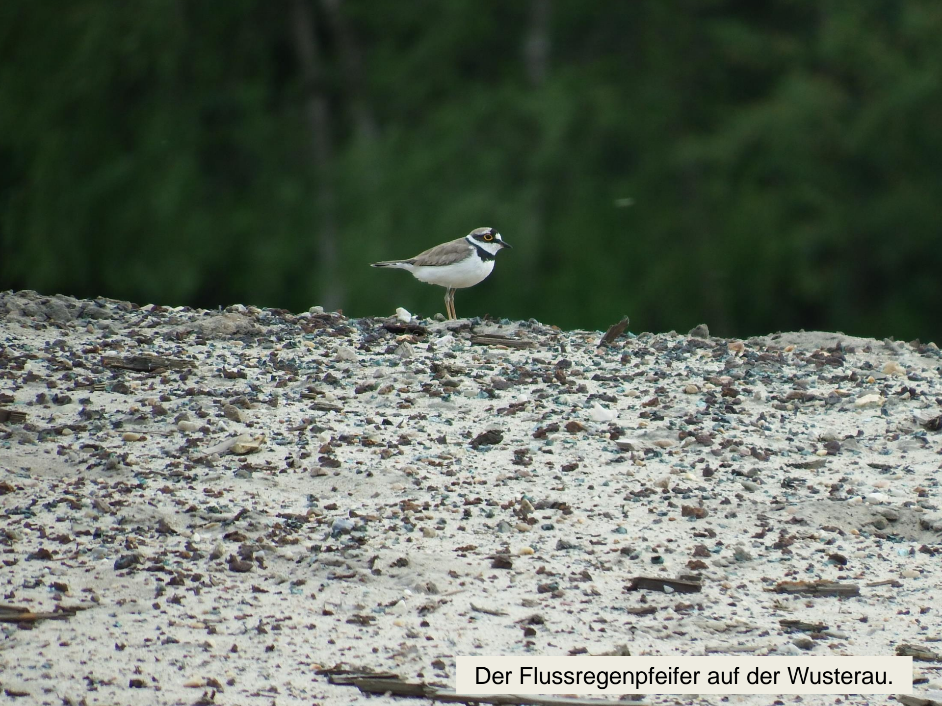
Der Flussregenpfeifer auf der Wusterau.