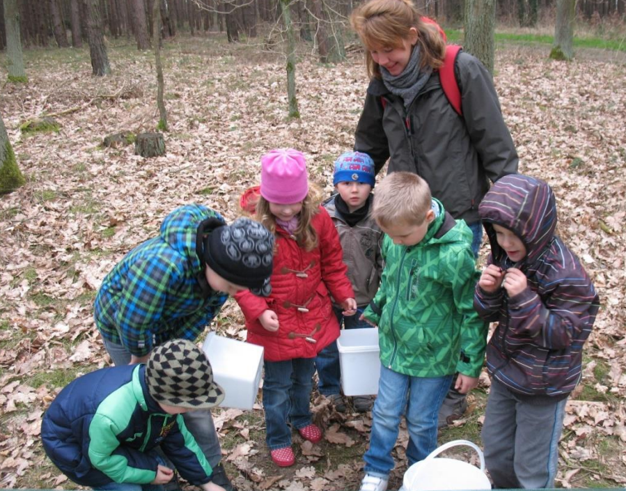
Kinder der Kita Netzen zu Besuch!