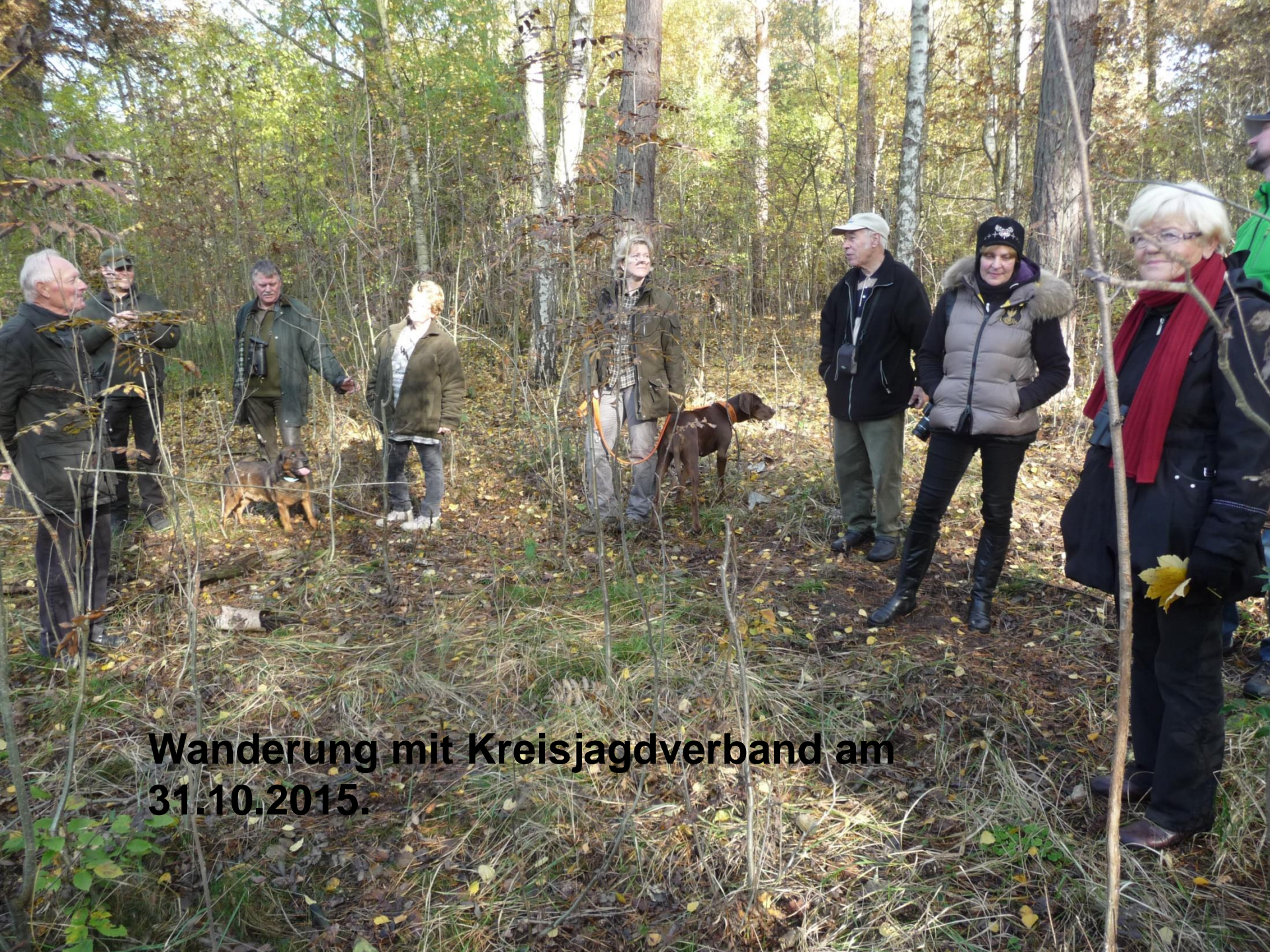
Wanderung mit Kreisjagdverband am 31.10.2015.